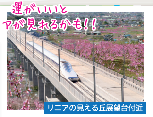
リニアが見える丘展望台付近