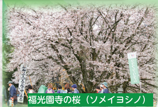
福光園寺の桜 (ソメイヨシノ)