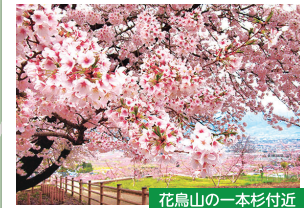
花鳥山の一本杉付近