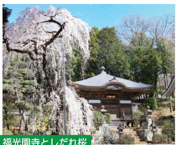
福光園寺としだれ桜