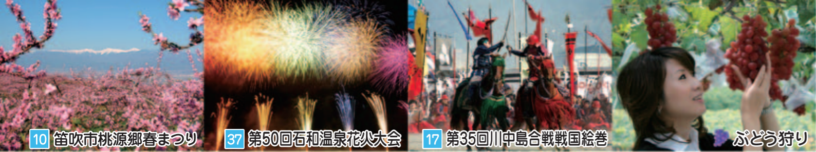
10 笛吹市桃源郷春まつり